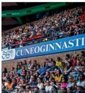
Il pubblico sugli spalti del Palazzetto dello Sport rennesi con una sventata