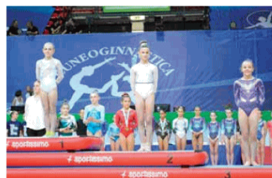
La premiazione delle Allieve 4.