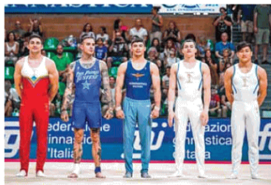
Gli atleti convocati per Parigi.